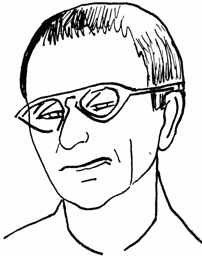
BERTOLT BRECHT